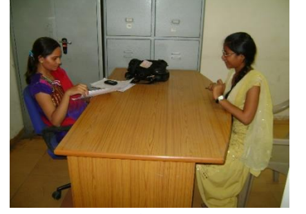
उद्विशा अंतर्गत ज़ोब-इंर