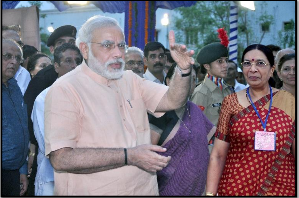
એન.સી.સી.ના વિદ્યાર્થીઓ સાથે સંવાદ કરતા માનનીય મુખ્યમંત્રીશ્રી