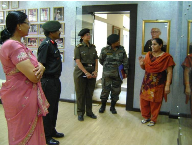
એન.સી.સી.ના ઉચ્ચ અધિકારીશ્રીઓ