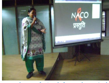
अये.आ.ई.वी.-अेईड्स अंगे जागृति सेमिनार