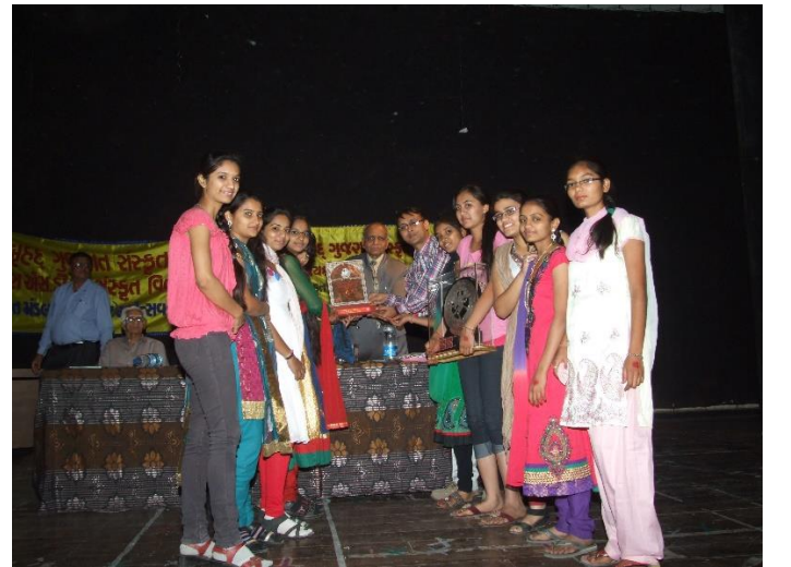
રાજ્યકક્ષાની સંસ્કૃત ગરબાસ્પર્ધામાં વિદ્યાર્થીનીઓની પ્રસ્તુતિ અને પ્રથમ ક્રમે વિજેતા