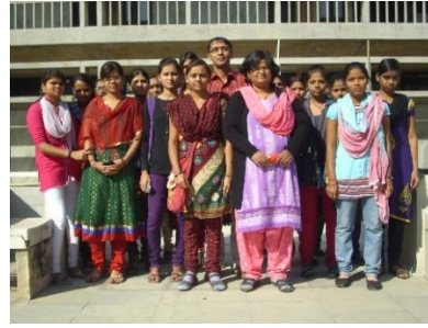
संस्कृत विषय द्वारा म्युजियमनी मुलाकात