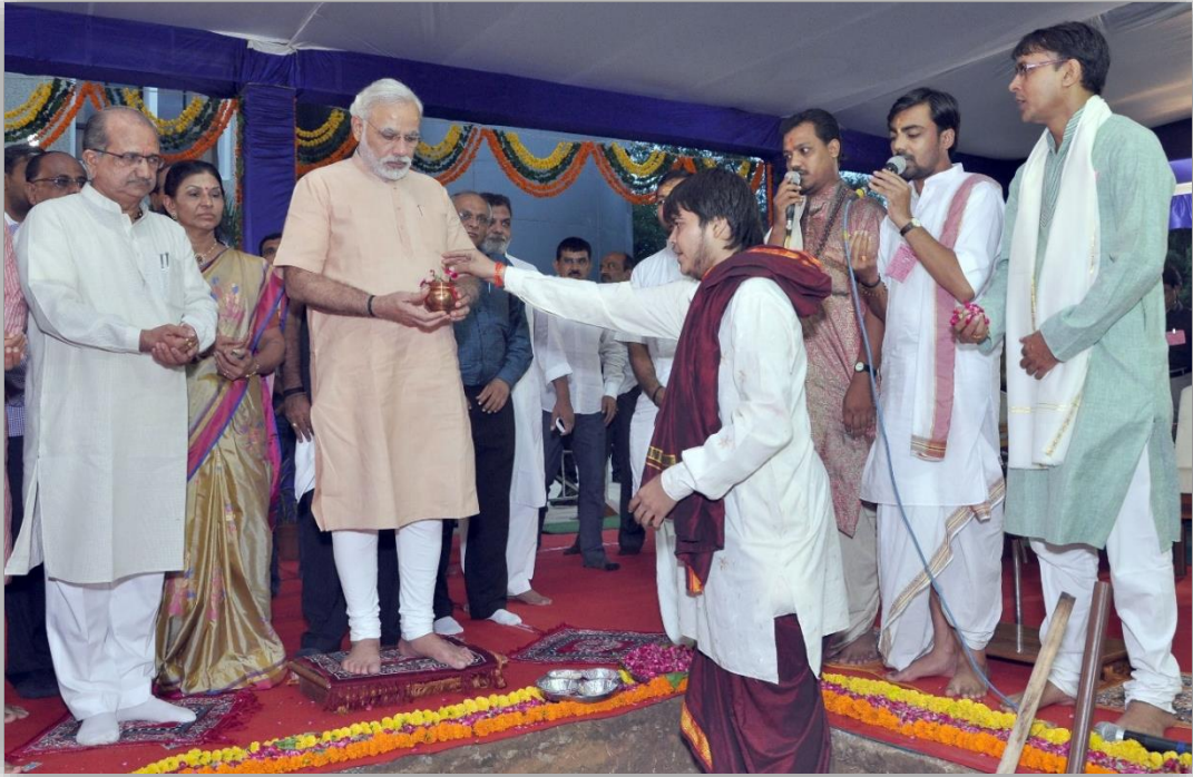
ખાતમુહૂર્તવિધિ કરતા માનનીય મુખ્યમંત્રીશ્રી નરેન્દ્ર મોદી