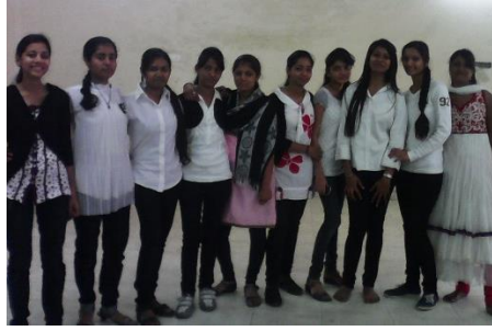
બ્લોક એન્ડ વ્હાઈટ ડે સેલિબ્રેશન