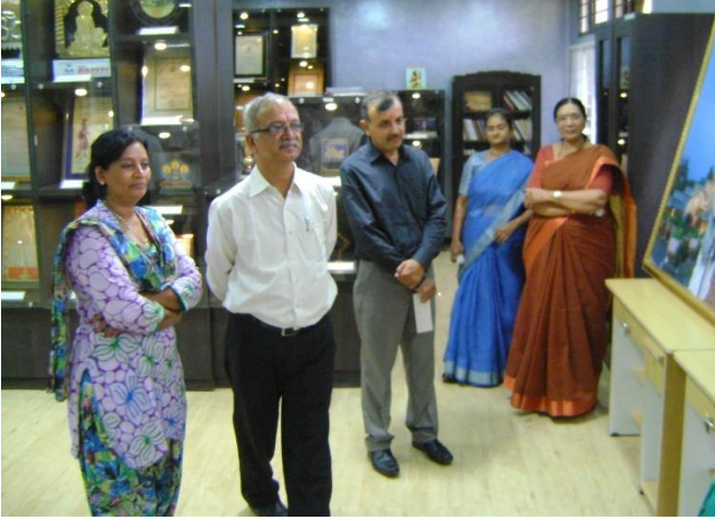
AAA એક્રેડિશનના સભ્યશ્રીઓ