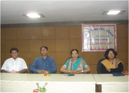
સંસ્કૃત સંભાષણ સમાહની શરૂઆત