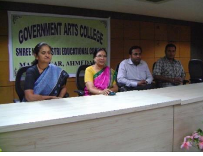
उद्विशा - मार्गदर्शन अने ज़ोब-इंर