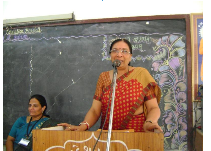
AAA એકેડિશન માટેની ટીમના સભ્ય તરીકે