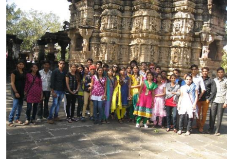
પોળોનાં મંદિરો ખાતે શૈક્ષણિક પ્રવાસ