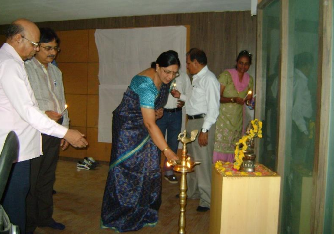
વિદ્યાર્થી કારકિર્દી માર્ગદર્શન વર્કશોપના ઉદ્ઘાટન પ્રસંગે