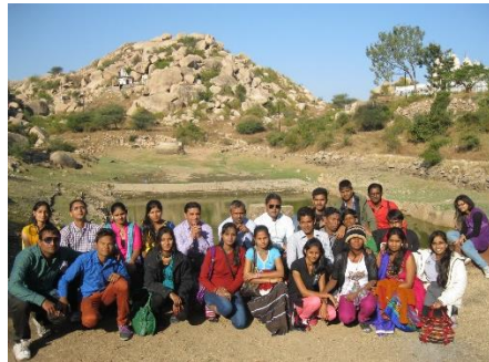
ઈડર ખાતે શૈક્ષણિક પ્રવાસ