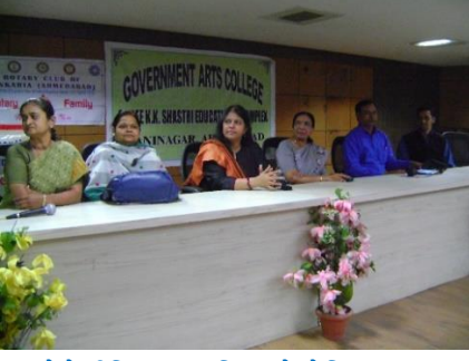
थेलेसीमिया जागृति अंगे सेमिनार