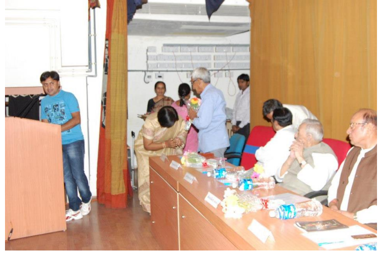
‘શબ્દસર’ સામયિકના સંપાદક તરીકે અને સંચાલક તરીકે