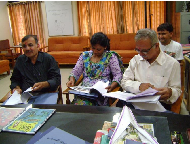
AAA એકેડિશન માટે રાજકોટથી પધારેલ ટીમ અને તેમની કામગીરી