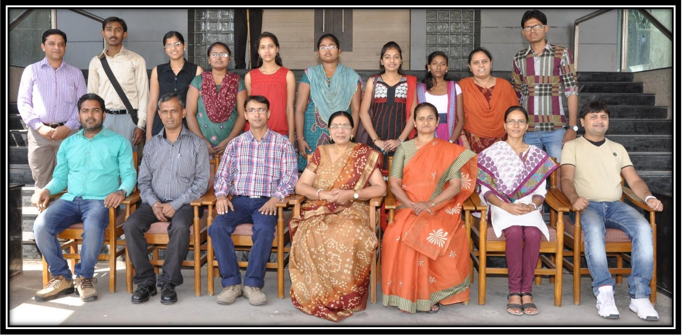
વિદ્યાર્થી-પ્રતિનિધિ-મંડળ સાથે કોલેજનો સ્ટાફ