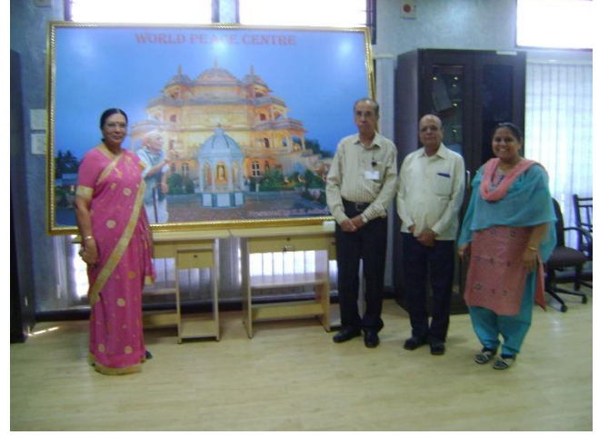
ગુજરાત સરકારના ઉચ્ચ અધિકારી શ્રી મોઢાસાહેબ