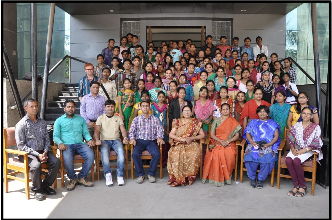
એસ.વાય.બી.એ.ના વિદ્યાર્થીઓ સાથે કોલેજનો શૈક્ષણિક સ્ટાફ