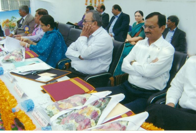
ગુજરાત રાજ્યના મંત્રીશ્રીઓ સાથે