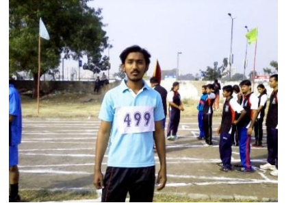
युनिवर्सिटी स्पोर्ट्स ईवेन्ट्समां विद्यार्थीओ