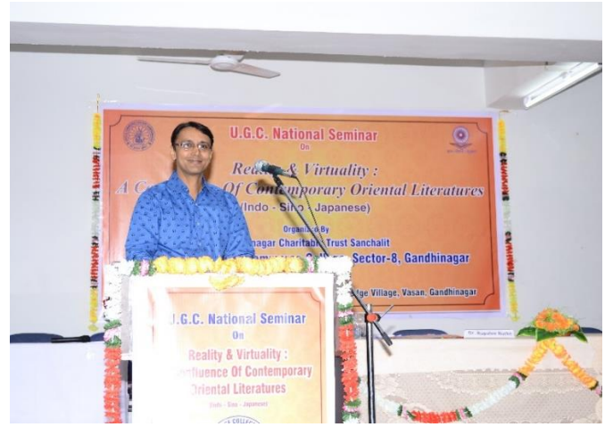
રાષ્ટ્રીયકક્ષાના સેમિનારમાં શોધપત્રનું વાચન