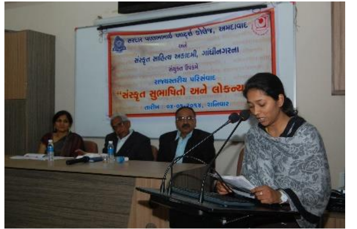
રાજ્યકક્ષાના સંસ્કૃત સેમિનારમાં વિદ્યાર્થીનીઓનું શોધપત્ર-વાચન