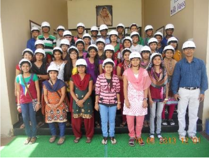
મુન્દ્રા ખાતે વિદ્યાર્થીઓનો શૈક્ષણિક પ્રવાસ