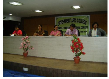
FYBAના વિદ્યાર્થીઓનું સ્વાગત