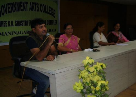
ભૂતપૂર્વ વિદ્યાર્થીઓનું મિલન