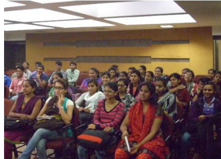
સંસ્કૃત સંભાષણ શીખતા વિદ્યાર્થીઓ