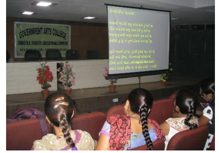
ગુજરાતી વિભાગ દ્વારા સેમિનાર