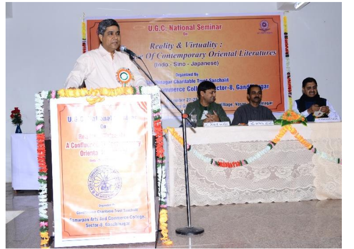
રાષ્ટ્રીયકક્ષાના સેમિનારમાં વક્તા તરીકે