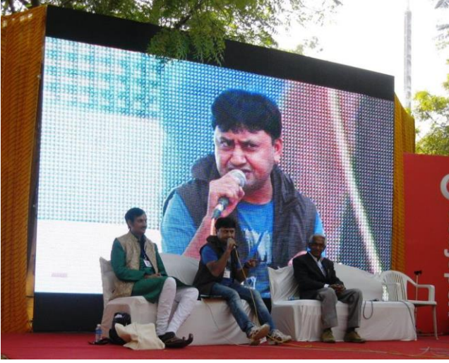
ગુજરાતી લિટરરી ફેસ્ટિવલમાં વક્તા તરીકે