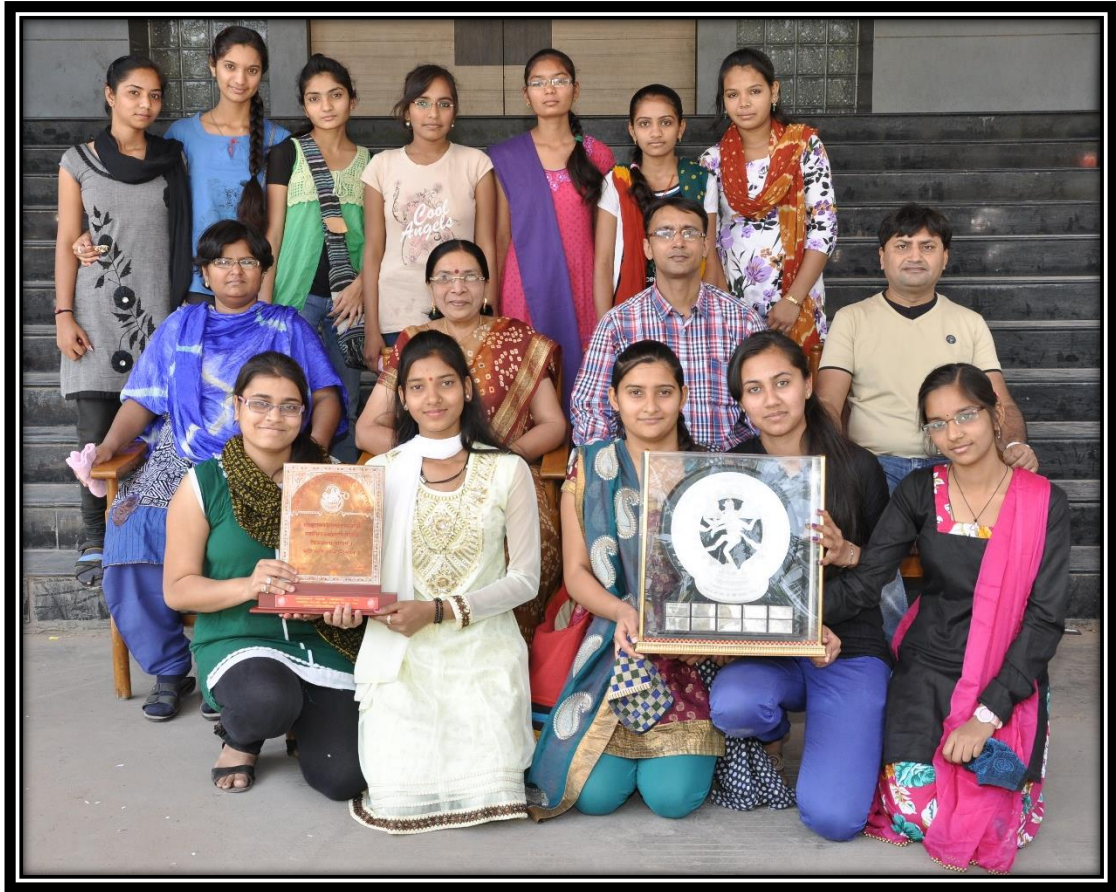
રાજ્યકક્ષાની સંસ્કૃત ગરબા સ્પર્ધામાં પ્રથમ ક્રમે વિજેતા થયેલ વિદ્યાર્થિનીઓ સાથે આચાર્યાશ્રી અને અધ્યાપકશ્રીઓ