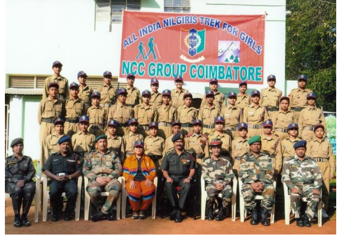
એન.સી.સી. મેજર તરીકે કેડટ્સ સાથે, કોઈમ્બતુર