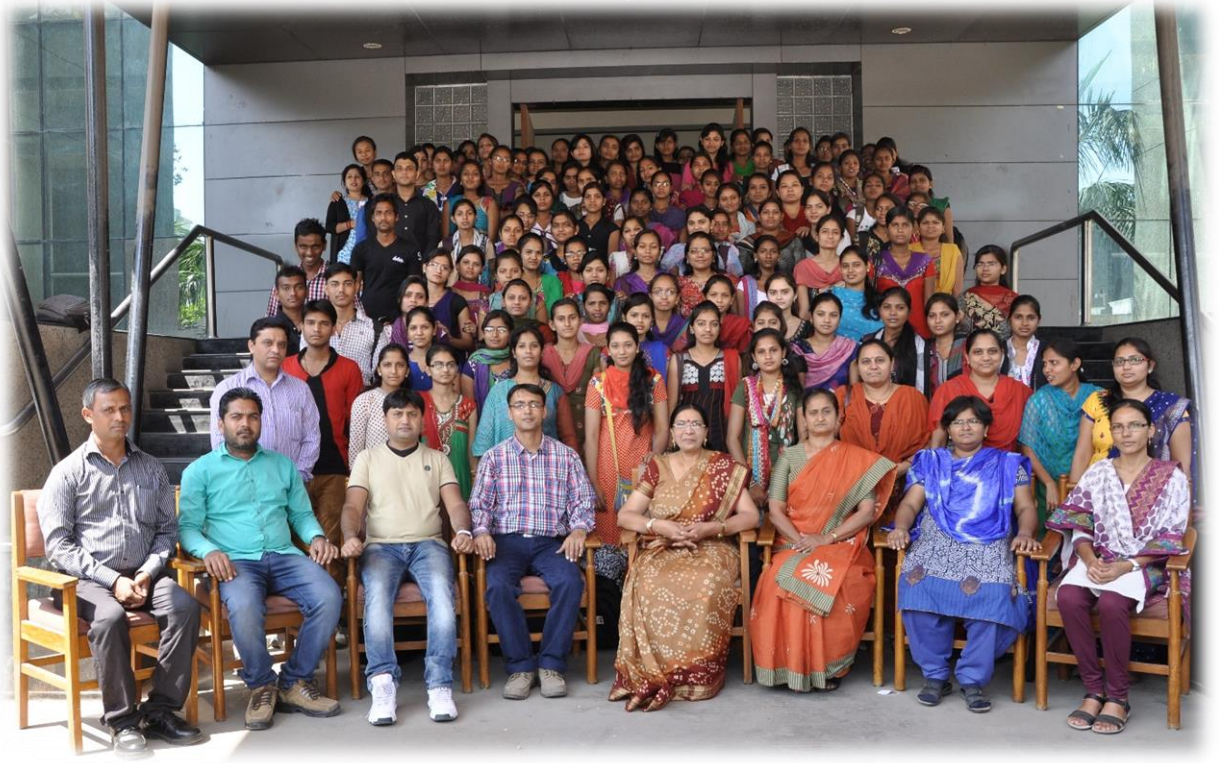
ટી.વાય.બી.એ.ના વિદ્યાર્થીઓ સાથે કોલેજનો શૈક્ષણિક સ્ટાફ