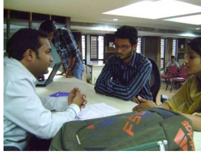
उद्विशा अंतर्गत प्लेसमेन्ट