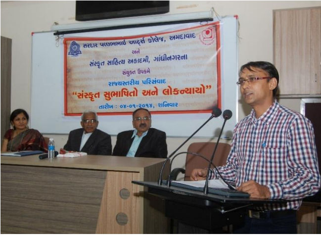
રાજ્યકક્ષાના સેમિનારમાં શોધપત્રનું વાચન