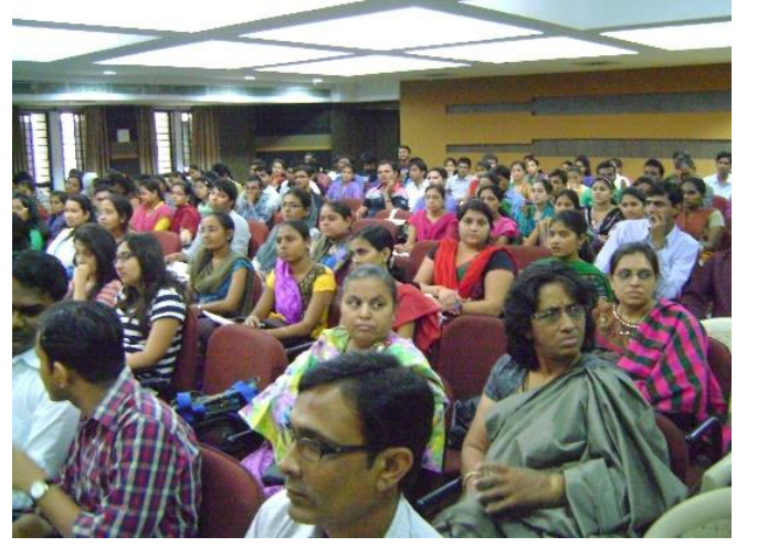
મનોવિજ્ઞાન વિભાગ દ્વારા આયોજિત બેદિવસીય રાજ્યકક્ષાના વર્કશોપનું ઉદ્ઘાટન અને ભાગ લેનારા શિબિરાર્થીઓ