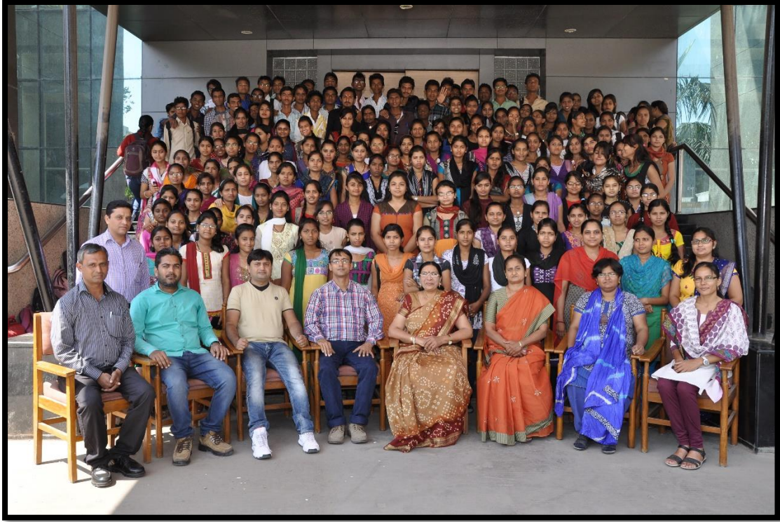
એફ.વાય.બી.એ.ના વિદ્યાર્થીઓ સાથે કોલેજનો શૈક્ષણિક સ્ટાફ